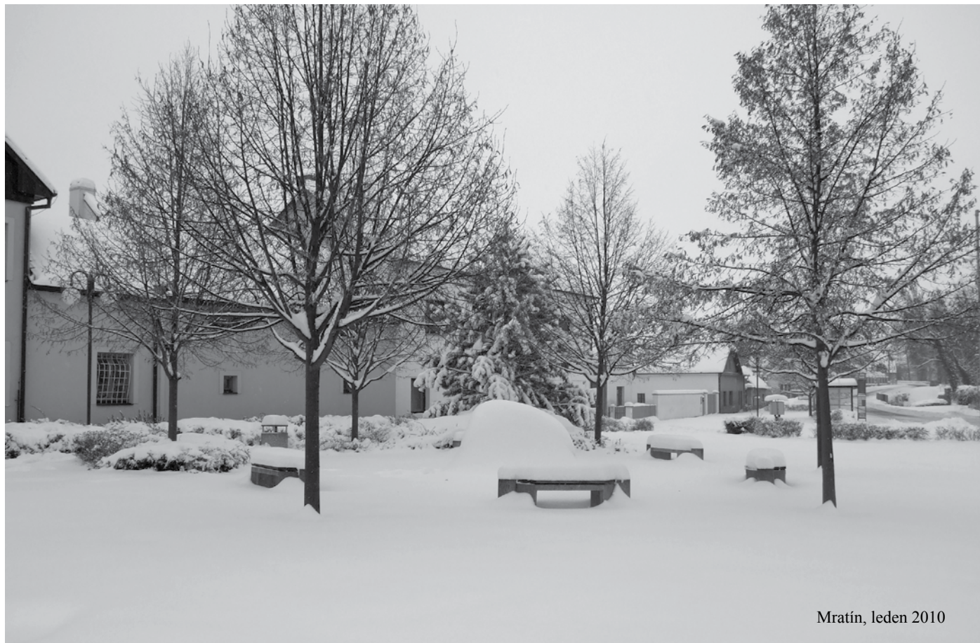
Mratín, leden 2010