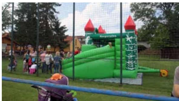
další fotografie na str. 7