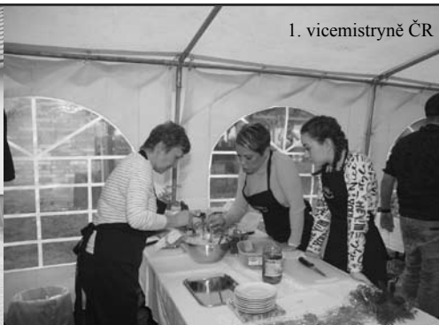
1. vicemistryně ČR