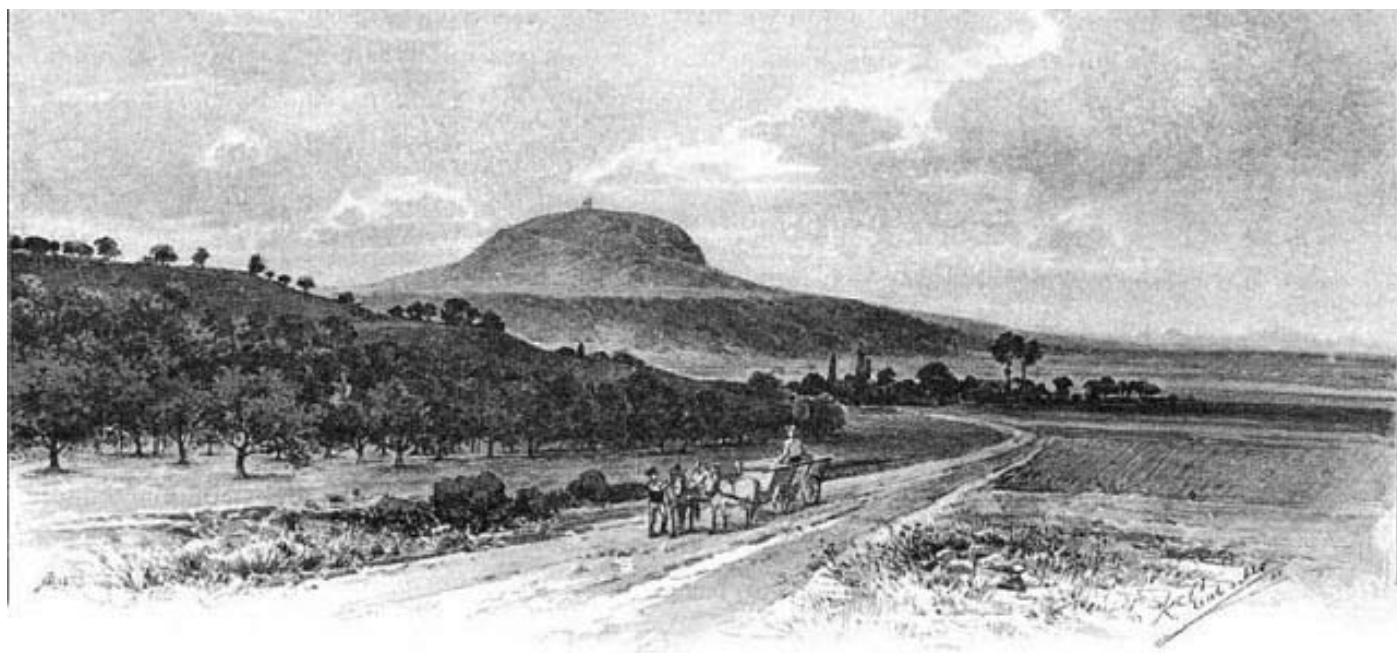
Říp. Pohled z východní strany.