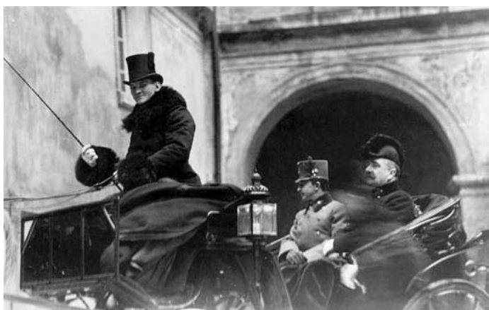
Na snímku císař Karel I. Rakouský v kočáře na nádvoří brandýského zámku 26. března 1917