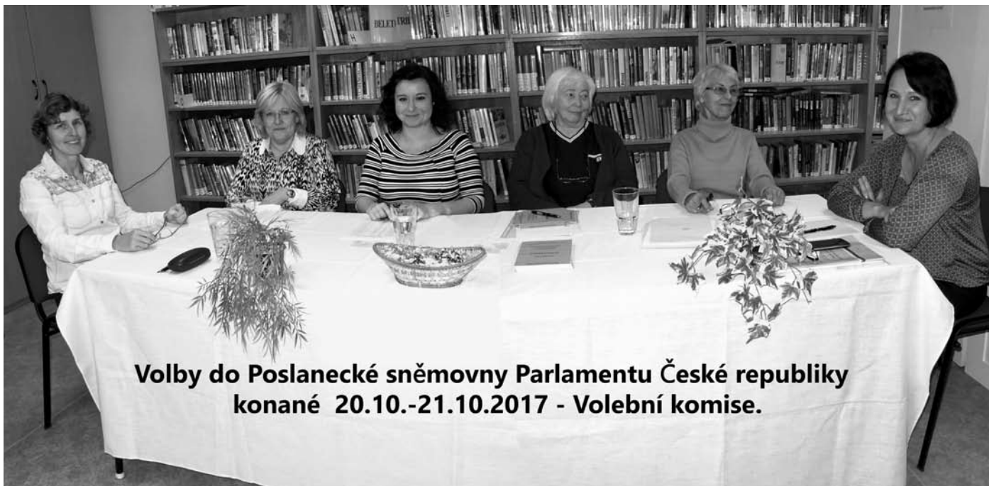
Volby do Poslanecké sněmovny Parlamentu České republiky konané 20.10.-21.10.2017 - Volební komise.

Výsledky voleb do Poslanecké sněmovny Parlamentu ČR 2017, konané ve dnech 20.10.-21.10.2017 v Mratíně. Počet zapsaných voličů v seznamu bylo 898, vydaných obálek 599, což představuje volební účast 66,7 %. Platných hlasů bylo 100 %, tzn. 599 hlasů.