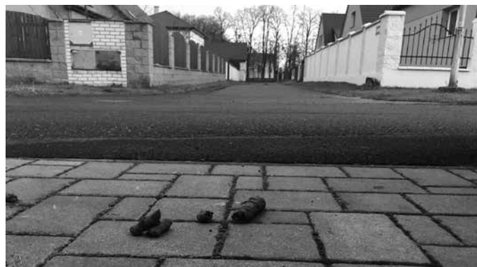
Novoroční zátiší (Mratín 1.1.2018)

Mohl bych mluvit o dalších problémech, ale je to asi zbytečné. Pokud občané nepochopí, že všechny finanční prostředky obce jdou vlastně z jejich kapsy, které obec dostává formou sdílených daní na trvale hlášené obyvatele a mohly by se využít v jejich prospěch, tak se situace nezlepší. Nejlépe se peníze šetří, když není potřeba je vynakládat na opravy nebo když obyvatele se chovají jako lidé doma v rodině, a není potřeba peníze vynakládat na nějaké hlídání policií či kamerový systém. (JF)